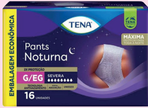
Roupa Íntima Tena Pants Noturna Severa P/M OU G/EG com 16un R$ 74,90 cada