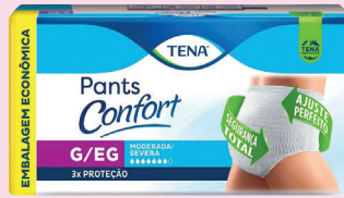
Roupa Íntima Tena Pants Confort P/M OU G/EG com 16un R$ 59,90 cada