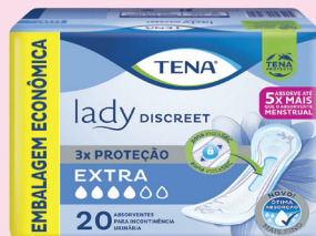
Absorvente para Incontinência Urinária Tena Lady Discreet Extra 20un R$ 42,90 cada