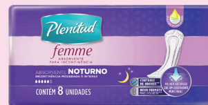
Absorvente para Incontinência Plenitud Femme Noturno com 8un R$ 22,90 cada