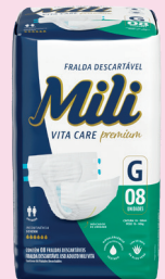
Fralda Geriátrica Mili Vita G8/m9/xg7 R$ 22,90 cada