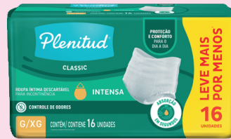
Roupa Íntima Plenitud Classic P/M OU G/XG com 16un R$ 54,90 cada