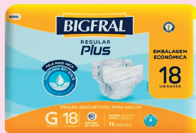
Fralda Geriátrica Bigfral Regular Plus G18/m20/xg16 R$ 64,90 cada