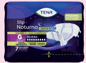
Fralda Geriátrica Tena Slip Noturna M OU G com 7un R$ 39,90 cada