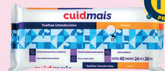
Toalha Umedecida Cuidmais Sênior com 40un R$ 11,90 cada