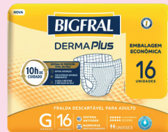
Fralda Geriátrica Bigfral Derma Plus G16/m18/xg14 R$ 64,90 cada